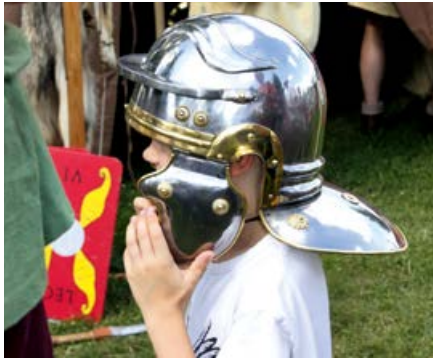
Aktionsstände am Römermuseum

Die Römerstadt Obernburg feiert mit den Limesorten im Landkreis Miltenberg von Reichartshausen bis Niedernberg am 2. Juni 2019 ihr Welterbe. Zum UNESCO-Welterbetag findet der Besucher auf dem Platz vor dem Museum Aktionsstände des Förderkreises Mainlimes-Museum. Das Leben bei den Römern wird hier für alle Sinne und Altersgruppen erfahrbar. Römische Kinderspiele laden zum Mitmachen ein, Rüstungen und Tuniken können anprobiert werden, eine Schreibwerkstatt öffnet, römische Heilkunde wird erläutert und vieles mehr. Dazu gibt es Mulsum und Mostbrötchen.